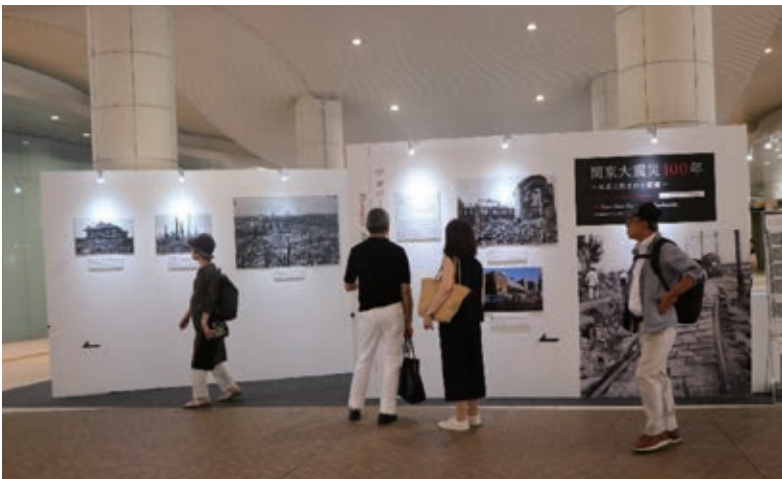
新橋駅方面から見た会場正面。拡大した「大きな被害を受けた横浜市電」の写真は図録の表紙やチラシにも使用した。その横には、いま通って来た新橋駅の100年前の姿。しばし立ち止まり、写真に見入る人が多い。

表したニュース映像だった。会場は地下歩道とはいえ両サイドの地上部分が大きく開いた構造で、新橋駅や周辺のビルからの冷気は全く届かない。来場者に大変な暑さを強いたことは悔やまれる。近く総括会議を開き今年の来場者動向の分析、来年のテーマや会場の選定などに取り組みたい。(東郷吾朗)