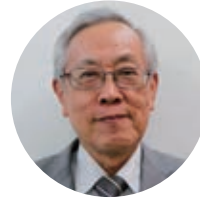
元共同通信社論説委員長 崇城大学名誉教授