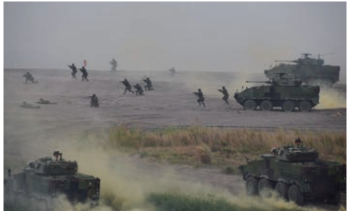
台湾北部・新北市の沿岸で実施された台湾軍の演習＝2023年7月

ただ台湾では「台湾有事は日本有事」と聞くと、台湾防衛のための自衛隊出動を連想する人も少なくない。台湾民意基金회가21年の安倍氏の発言前に実施した世論調査で、中国が台湾に武力攻撃した際に「日本が出兵して台湾防衛に協力すると思うか」との問いに58%が「見込みあり」と回答。ただ憲法上の制約がある中、自衛隊が直接台湾防衛に加わるという発想は、日本人の