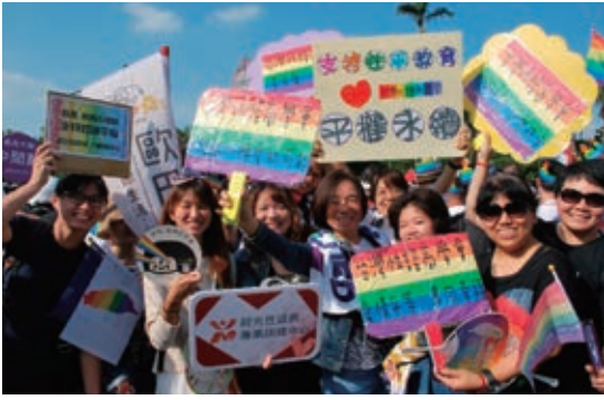
LGBTパレードで同性婚への支持を訴える参加者 (2018年10月27日、台北市内)

り、他人のプライバシーを過度に詮索しない。こうしたことから、いわゆる同調圧力を感ずるところとはほと