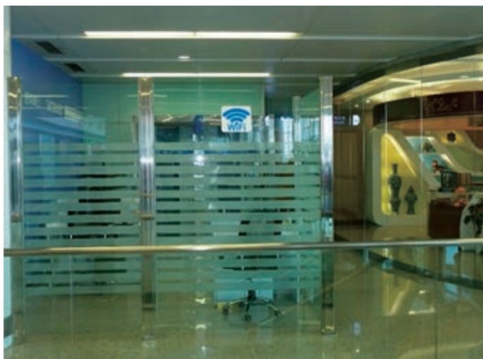
平壤国際空港にあるWi-Fiコーナー（2019年6月）

どちらも外国人にだけ提供するサービスとして昨年ぐらいいから始められたようだ。外国人専用の場所での限定された使用ということなのだが、われわれ以外に申し込ん