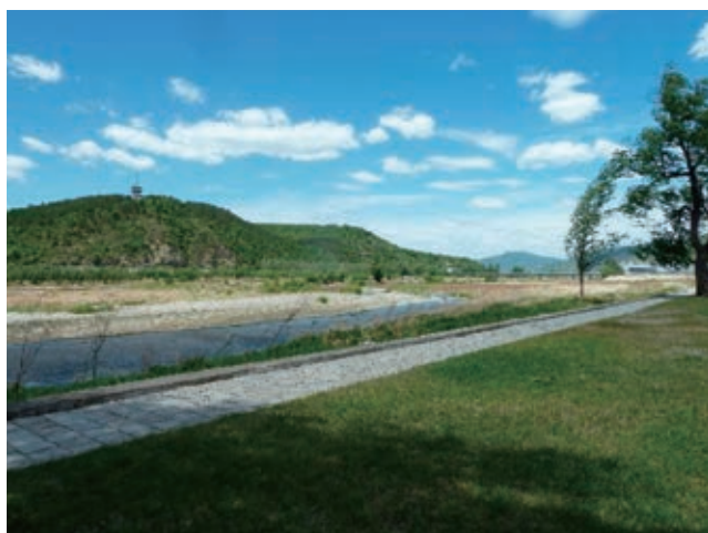
北朝鮮・会寧から見た中朝国境。川は豆満江で対岸は中国吉林省。向こうに橋が架かっている(2019年5月)

鮮対外文化連絡協会(対文協)の職員はもちろん、咸鏡北道人民委員会対外事務部や清津育児院などの職員に至るまで、スマホは普及していた。一般市民がどの程度まで所持しているかは確認できなかったが、少なくとも業務に必要な人はみな所持している。