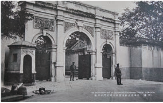
日本軍司令部 (天津) = 絵はがきより