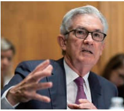
パウエルFRB議長(米ワシントン、2021年7月15日)

一方で、パウエル氏は、条件が整うには「遠い道のりがある」との認識を繰り返し、慎重に検討していく考えを強調。7月のF