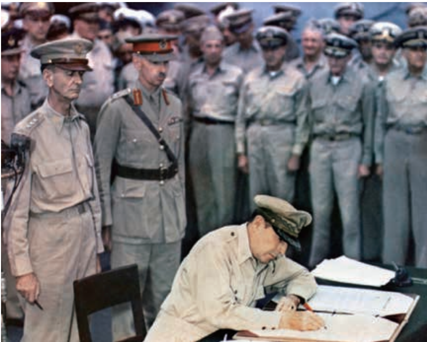
(写真3) 署名するマッカーサー最高司令官の後ろに立つウェインライト米中將(左)と、パーシバル英中將

に、満州の捕虜収容所から数日前に救出されたウェインライト米中將と、パーシバル英中將の2人を特に招いた。自分の真後ろに2人を立たせ、調印文書に署名をするためにペンを換え、一人ずつ手渡し、両將軍の名誉回復を果たした(写真3)。この場面を加藤は「この日最も劇的な場面であつ