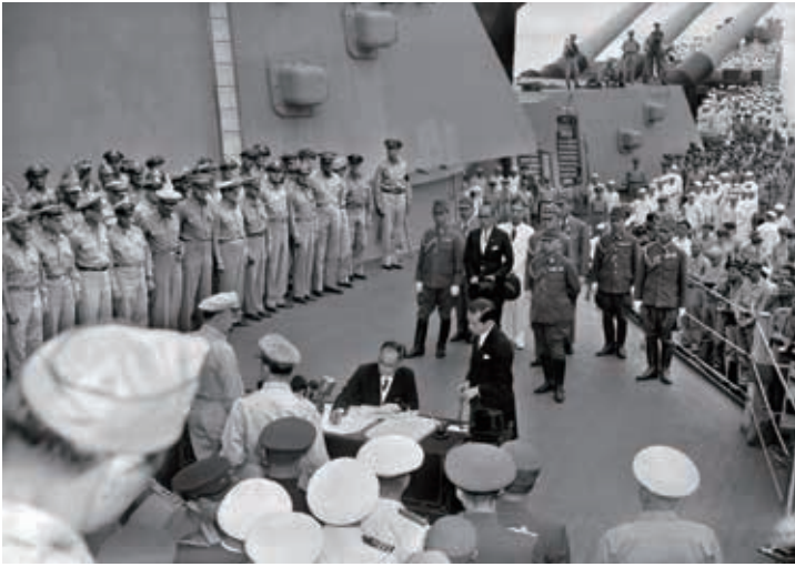
(写真1) 降伏文書に調印する重光全権。1945年9月2日、東京湾上のミズーリ号